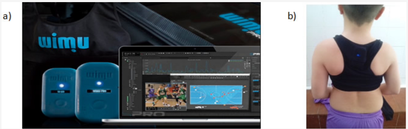
Figura 1. (a) Dispositivo WIMU PROTM, arnés específico y software S PROTM y (b) introducción del dispositivo WIMU en el peto específico y colocación del mismo en uno de los jugadores participantes en la investigación.

Para ubicarles a los jugadores los dispositivos de seguimiento, estos eran citados 15 minutos antes del comienzo de cada sesión de entrenamiento y en los partidos se les colocaba antes de iniciar los ejercicios de calentamiento. Previamente a su colocación, los dispositivos fueron calibrados y sincronizados. La calibración de los mismos se realizó mediante un sistema de autocalibrado que incorpora cada dispositivo en la configuración interna del arranque. Para el autocalibrado se tuvo en cuenta tres aspectos: (i) dejar el dispositivo inmóvil durante 30 s, (ii) situarlo en una zona plana y (iii) sin dispositivos magnéticos alrededor (Bastida-Castillo, Gómez-Carmona, y Pino-Ortega, 2016). Para la sincronización entre los dispositivos de seguimiento, estos se colocaban en una caja estanco y posteriormente se giraban 360°, para que de esta forma posteriormente en el análisis de los datos se pudieran vincular los tiempos de los mismos de forma automática. Los datos obtenidos por los dispositivos fueron sincronizados y extraídos para su posterior análisis mediante el software S PROTM (RealTrack Systems, Almería, España).