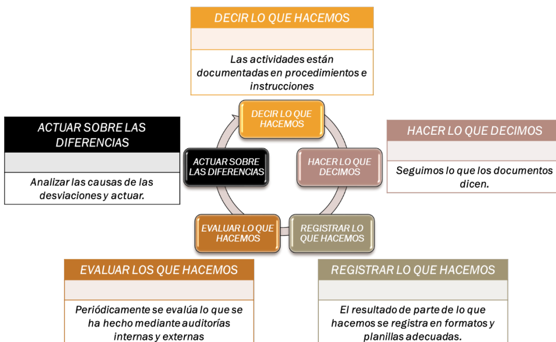
Figura 3. Ciclo continuo del Sistema de Calidad aplicado a la intervención del entrenador de baloncesto (tomado de Ibáñez, 2009).

Con independencia de la formación y conocimiento científico de los entrenadores se precisa tener información a dos niveles, descriptivo e inferencial (Cubo et al., 2011).