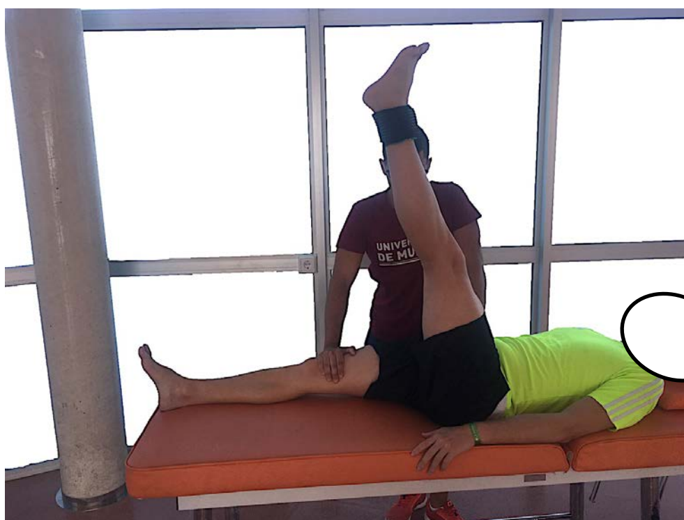
Figura 2. Realización del test activo de elevación de la pierna recta en uno de los participantes en esta investigación.

Antes del comienzo de la sesión, los participantes realizaron un calentamiento general de 5 minutos de carrera a pie a intensidad aeróbica (PSE 4-5/10) y 10 minutos de calentamiento específico compuesto de estiramientos balísticos y ejercicios de movilidad articular de la cadera y el tren inferior. El intervalo del calentamiento se monitorizó en tiempo real mediante el software S PRO™ para comprobar que los dispositivos funcionaban correctamente. Al terminar el test, los sujetos realizaron 5 minutos de carrera continua a baja intensidad.