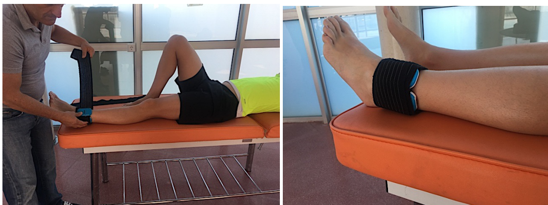
Figura 1. Fijación de los dispositivos WIMU PRO™ mediante una banda elástica y posicionamiento final de los mismos en la parte externa de la pierna en uno de los participantes en esta investigación.

Todas las repeticiones realizadas por los participantes fueron registradas mediante una cámara EX-ZR1200 (CASIO, Tokio, Japón), utilizada como criterio de medida, para analizar el RAM y el tiempo de duración que los atletas necesitan para completar cada repetición del test AEPR. Por otra parte, cada participante portaba dos dispositivos WIMU PRO™ (RealTrack Systems, Almería, España). Los dispositivos se encontraban en la parte externa del tobillo a una distancia de 2 centímetros en paralelo, fijados mediante una banda elástica específica, según muestra la figura 1. Antes de colocar los dispositivos, estos fueron calibrados y sincronizados siguiendo las indicaciones del fabricante.